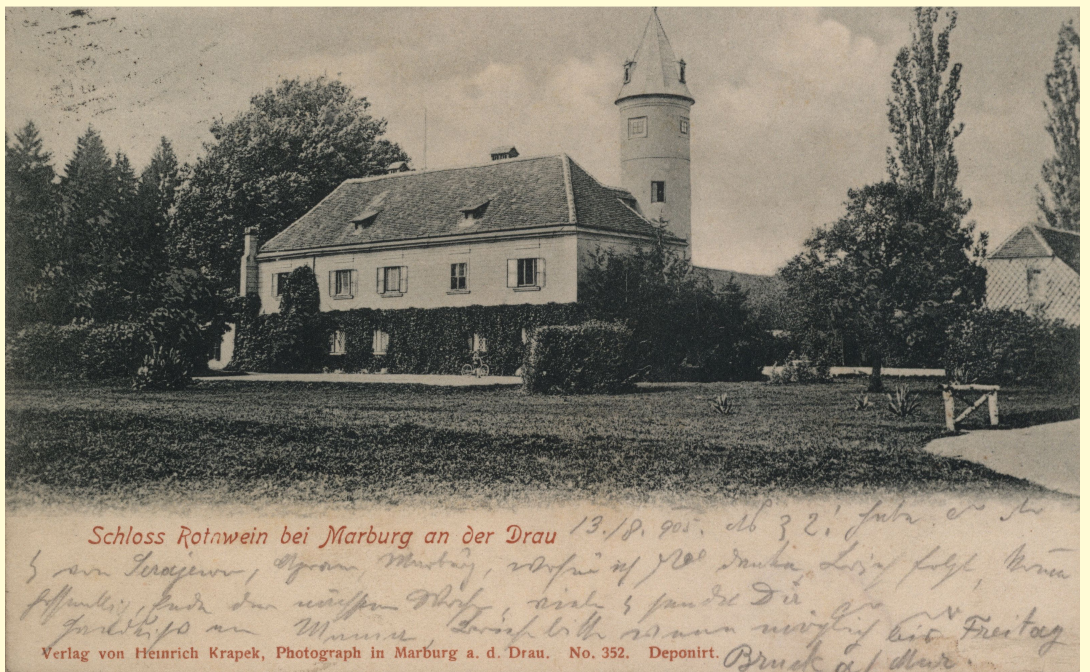
Radvanjski dvorec s platano v ozadju - razglednica odposlana leta 1905

Najdebelejša platana na območju Maribora raste v parku pri dvorcu Betnava. Njen obseg debla meri kar 785 cm in je tudi najdebelejše drevo območja mesta.