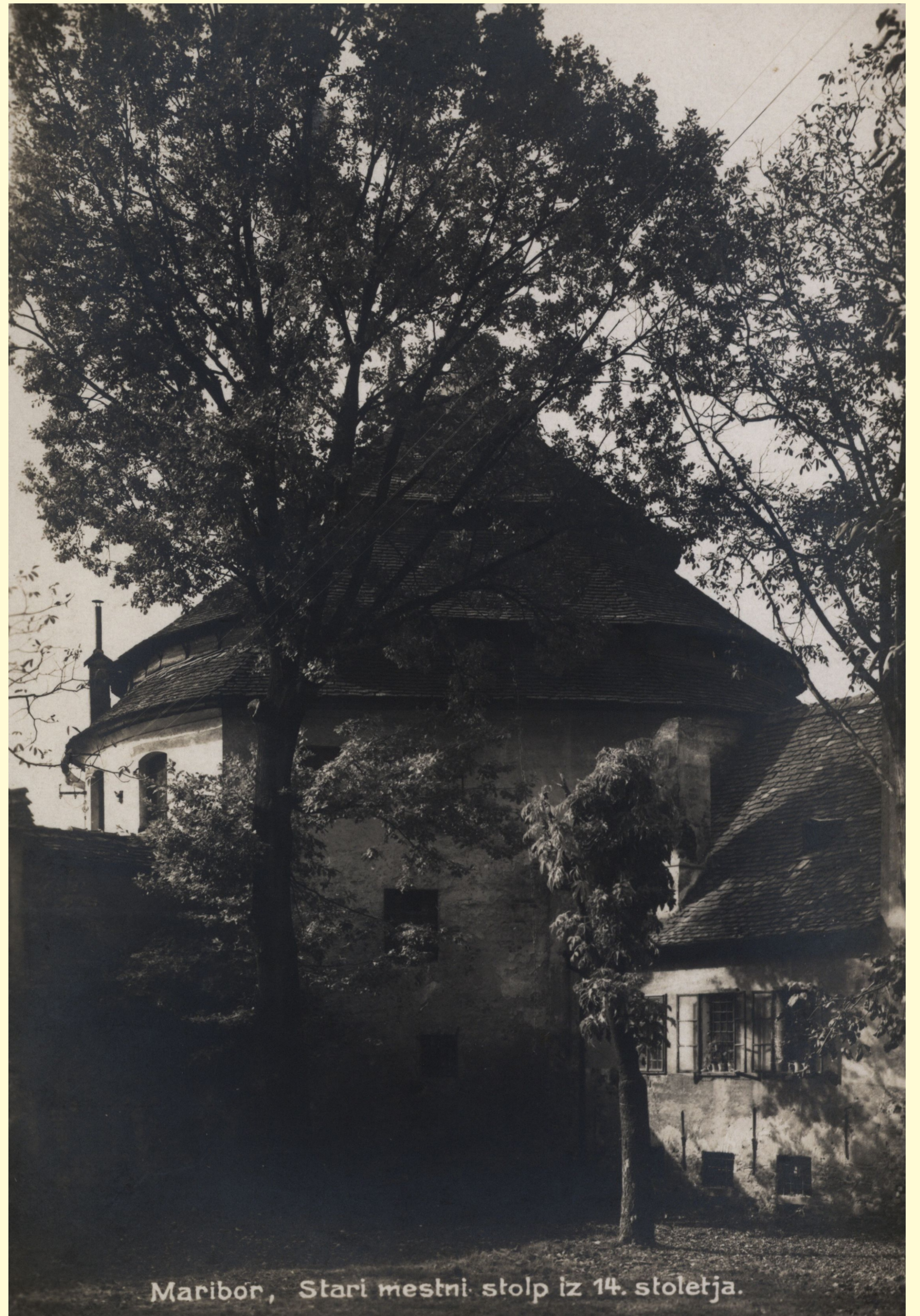
Maribor, Starí mestní stolp iz 14. stoletja.

Hrast dob je drevesna vrsta, ki je v naravi značilna za nižinske predele, za globoka, bogata tla z visoko podtalnico, tudi občasno poplavljena. Dobro prenaša mestno okolje in lahko doživi visoko starost, celo tisoč let. Ta hrast nima idealnih rastiščnih razmer, kar se odraža v njegovi dokaj počasni rasti in zmanjšani vitalnosti v zadnjih letih, kar je tudi posledica večjih gradbenih del v bližini na obeh straneh obzidja, ki so lahko imela vpliv na vlažnostne razmere v tleh ter na velikost območja koreninskega sistema drevesa. Z rednimi vzdrževalnimi deli ohranjamo drevo v čim bolj ugodnem stanju, v letu 2019 pa so bili izvedeni tudi ukrepi za izboljšanje rastiščnih razmer. Kot enega ključnih dejavnikov za drevo je potrebno ohranjati rahlost tal v ravnem prostoru drevesa ter ohranjati ali celo dodajati organski opad.