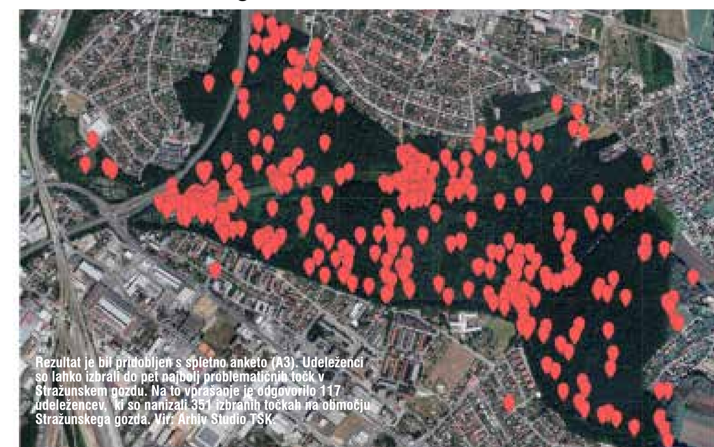
Prva asociacija na Stražunski gozd