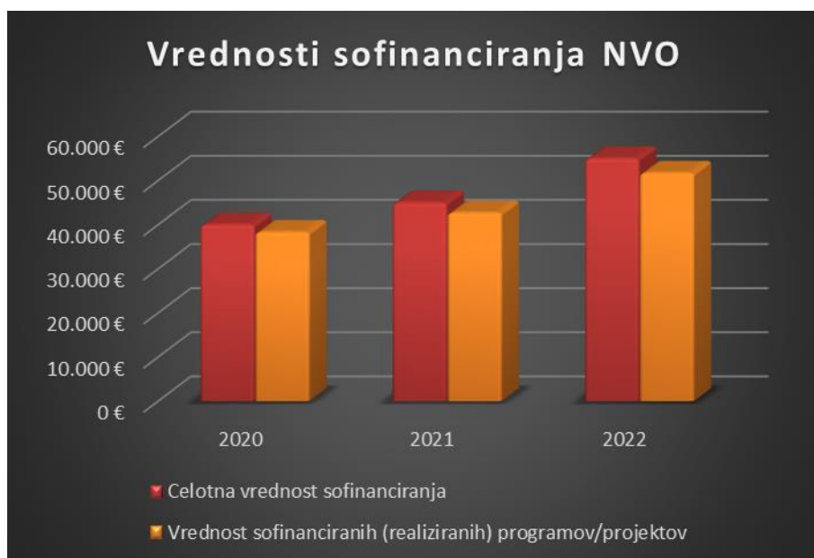
Graf 1: Prikaz vrednosti sofinanciranja NVO v letih od 2020-2022

*Prijavitelju je bil 1 projekt odobren, drugi projekt pa neodobren, zato se 1 projekt več pojavi tudi med odobrenimi projekti)