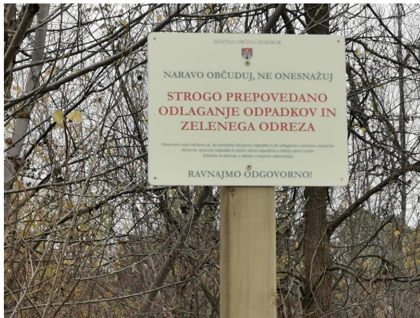
Slika 1: Tabla na območju Dogoš