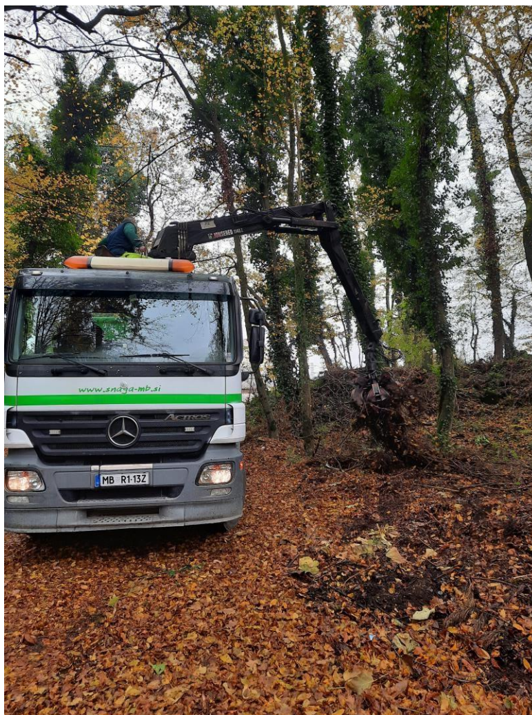
Slika 2: Odvoz zelenega odreza