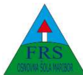
OŠ Franca Rozmana Staneta