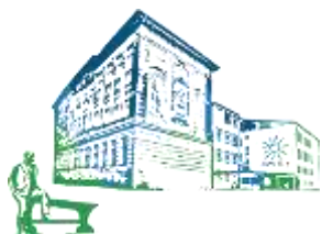
OŠ Prežihovega Voranca