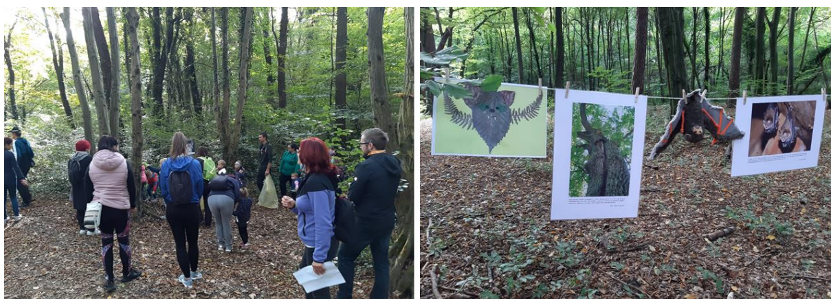
Slika 10: Prvi vikend v oktobru ni posvečen le Svetovnemu dnevu habitatov, temveč tudi Svetovnemu dnevu varstva živali in Evropskemu dnevu opazovanja ptic. S pestrim programom smo s sodelujočimi organizacijami tematsko pokrili vse cilje omenjenih naravovarstvenih/ okoljskih dni.