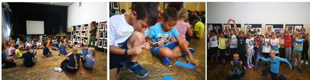
Slika 5: 24.8.2020. Otroci so najprej spoznali, da netopirji ne letajo s perutni temveč s prhutmi (gre za tanko elastično opno razpeto med podaljšanimi kostmi sprednjih okončin in telesom ter med zadnjimi okončinami in repom), nakar so izdelali netopirske magnetke ter tik pred zaključkom delavnice botrovali k »eni gasilski«.

Tretjo delavnico smo izvedli v mestnem parku Maribor. Vreme nam je bilo naklonjeno in tako so številni obiskovalci Festivala Lent postali in si ogledali netopirsko fotografsko razstavo. Prešteli smo vsaj 30 otrok, ki so starše prepričali, da postanejo za dlje časi in si izdelajo svoj netopirski magnetek, pobarvajo pobarvanko, rešijo kviz, se poigrajo z »netopirskimi« sestavljankami in še bi lahko naštevali. Hkrati so varovanci Zveze prijateljev mladine Maribor (12 otrok pod budnim očesom 2 vzgojiteljic) tudi tokrat, kot dogovorjeno, prišli na vodeno delavnico, ki smo jo pričeli z ogledom netopirskih fotografij in kratko predstavitevijo netopirjev. Nakar so reševali križanke, barvali pobarvanke in izdelovali netopirske magnetke.