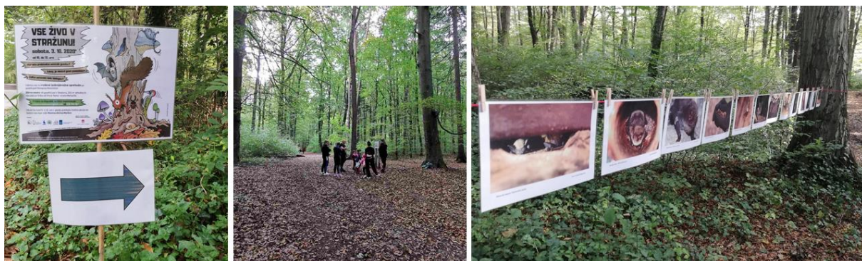
Slika 9: Udeleženci so se preko fotografskih razstav naučili marsikaj o živalskih in rastlinskih prebivalcih Stražuna, o spoštljivem odnosu v naravi in do narave, o pomembnosti parkov, gozdov, travnikov