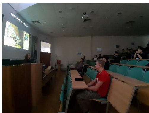
Slika 4: Bodoči gozdarji iz srednje Lesarske šole Maribor so pozorno poslušali, kako lahko netopirjem pomagamo z netopirnicami in kako se le-te izdeluje.