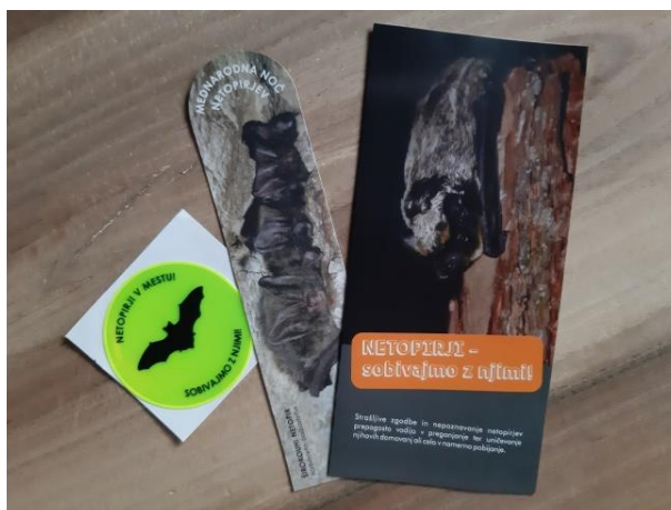
Slika 11: Izobraževalni promocijski material

Pripravili smo izobraževalni promocijski material: zloženko in bralno znamenje (knjižno »kazalko«). Vsebina zajema osnovno biologijo netopirjev, poudarja njihovo prisotnost v mestih oz. urbanih okoljih. Izobraževalni promocijski material je opremljen s sliko in besedo ter kot tak primeren za vse generacije. Pripravili smo tudi varnostne odsevne nalepke , ki so na terenu v večernih urah poskrbele za varnost naših najmlajših udeležencev.