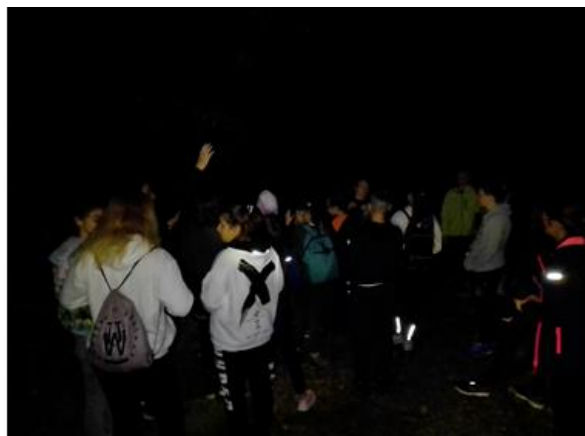
Slika 3: Pod mentorstvo in spremstvom učiteljice ga. Eve Sternad so osnovnošolci prikorakali na jaso v Stražunu, kjer smo skupaj spoznavali te skrivnostne nočne letalce.