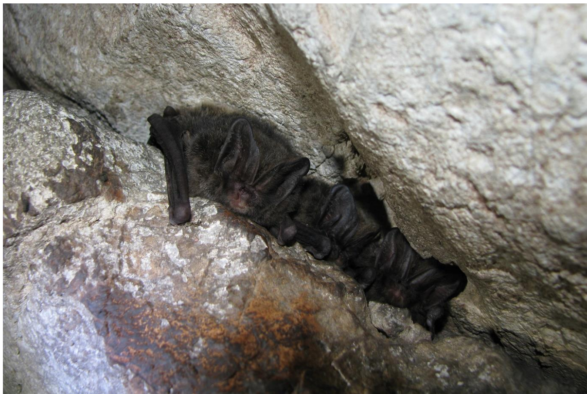
Slika 12: Širokouhi netopir je bil v Evropi izbran za netopirja leta za dve leti, 2020 in 2021. To je razlog, da je njegova fotografija našla mesto na našem projektnem bralnem znamenju.

Vse zadane aktivnosti smo kljub temu uspešno izvedli, pravzaprav celo presegli, saj se interes za predstavitve netopirjev po šolah in vrtcih še nadaljuje. Udeležba in odzivi udeležencev ter vseh vpletenih so bili nadvse pozitivni in spodbudni. Spoznavanje netopirjev v Mariboru se tudi v naslednjem letu načrtuje in nadaljuje! Se vidimo naslednje leto!