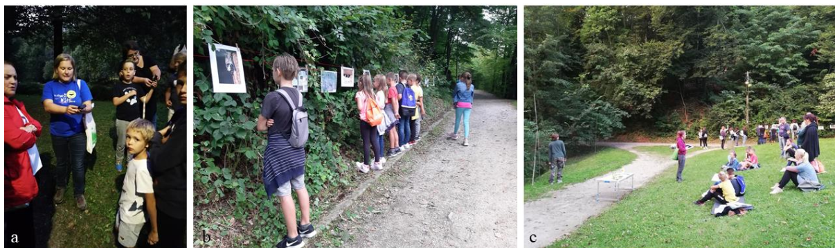
Slika 7: Obeležitev Mednarodne noči netopirjev v Mestnem parku Maribor ob Treh ribnikih. a) Podajanje navodil za rokovanje z ultrazvočnim detektorjem, s katerim lahko slišimo eholokacijske klice netopirjev. b) Netopirska fotografska razstava na prostem, ni bila zanimiva le za udeležence aktivnosti, temveč tudi za naključne mimoidoče. c) Na dogodku smo oblikovali kar dve večji skupini, saj je obisk presegel naša pričakovanja.

ribnikih v Mestnem parku Maribor ozaveščali meščane o skrivnostnih nočnih letalcih. Predstavili smo metode proučevanja netopirjev. S pomočjo ultrazvočnih detektorjev smo uspešno prestrezali eholokacijske klice obvodnih netopirjev, ki so se prehranjevali nad ribnikom - tik nad vodno gladino. Hkrati pa smo spoznali še dodatno metodo proučevanja netopirjev, in sicer mreženje. Udeleženci, niso le spoznali netopirjev od blizu in si strmeli z njimi iz oči v oči, temveč so se podučili o pomembnosti netopirjev v naravi in o pomembnosti našega spoštljivega odnosa do vsega živega. Skupno se je dogodka udeležilo vsaj 70 oseb.