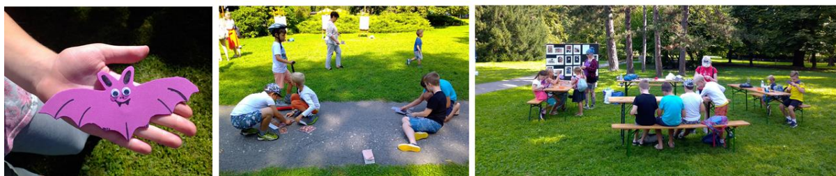
Slika 6: 28.8.2020. Spoznavanje netopirjev na v Mestne parku Maribor v okviru Festivala Lent 2020