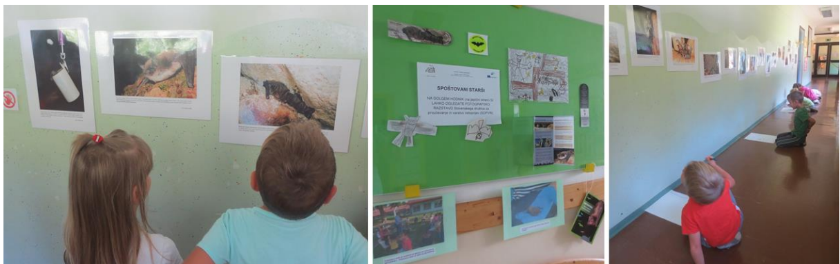
Slika 2: Spoznavanje netopirjev na fotografski razstavi v vrtcu. Sledilo je ustvarjanje netopirjev na papirju kot jih vidi otroško oko.