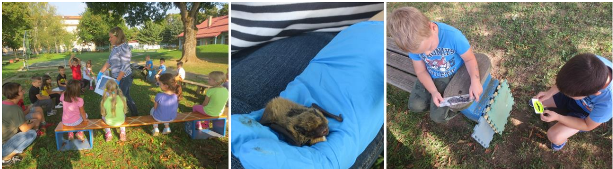
Slika 1: Spoznavanje netopirjev v živo pod krošnjo vrtčevskega drevesa je imelo prav poseben čar.

Hkrati so skupaj z vzgojiteljicami postavili netopirsko fotografsko razstavo in pripravili informativni netopirski kotiček, kjer so se o netopirjih in o projektu lahko informirali tudi starši. Razstava je bila na ogled od 14.9.2020 do 2.10.2020.