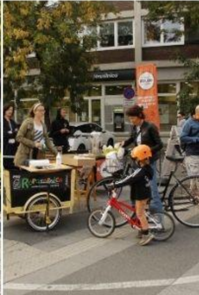
Zajtrk za kolesarje