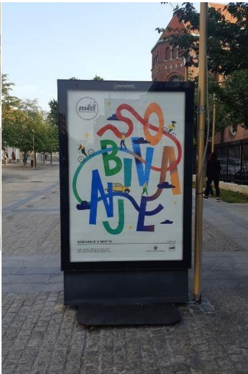
Natečaj za oblikovanje