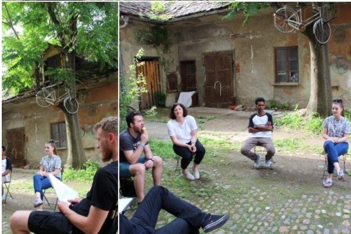
Poziv in srečanje s prostovoljci