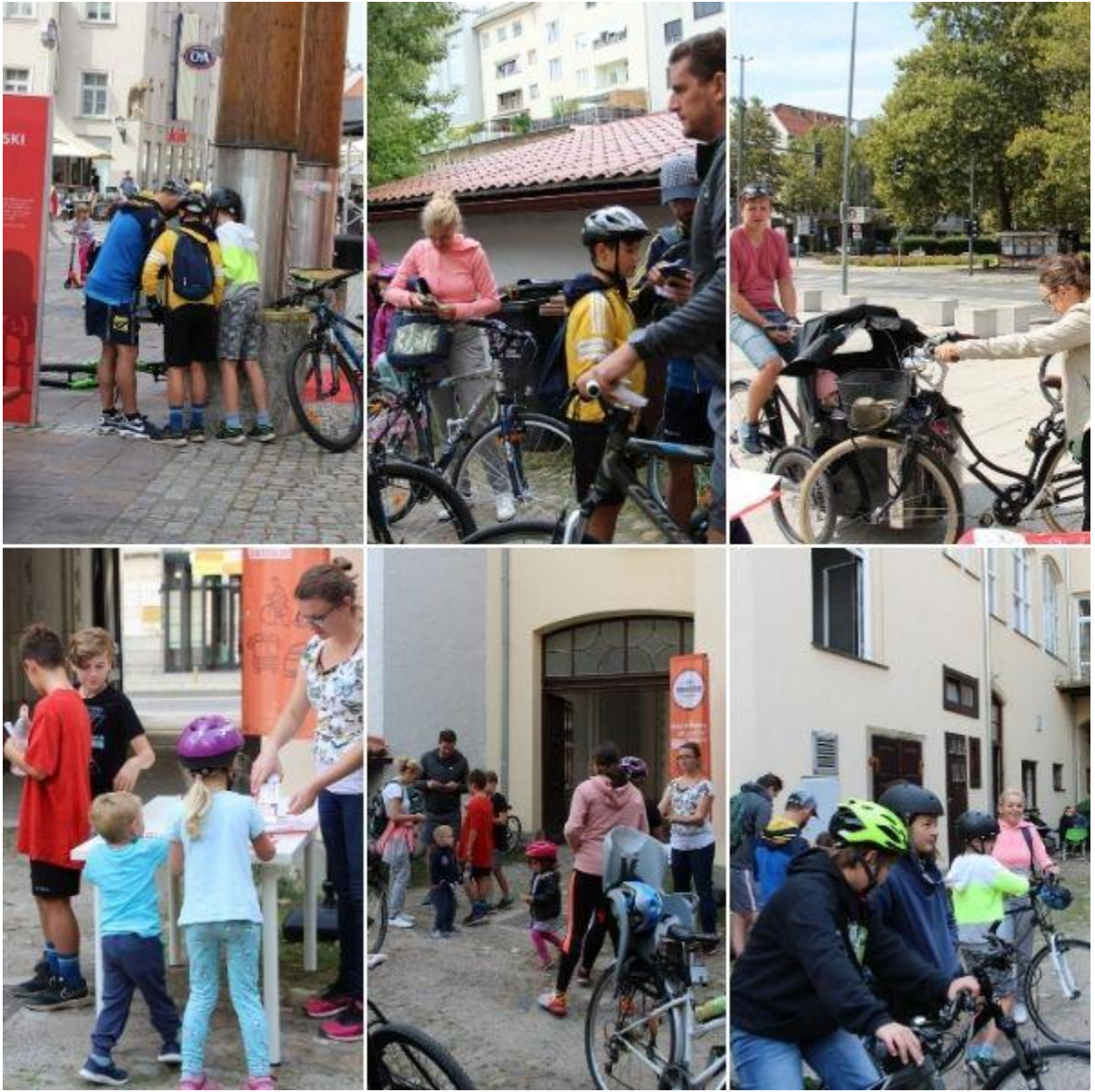
Lov na zaklad – Bike Climate Challenge