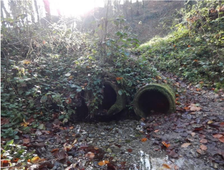
Fotografija 4: Izvir 4 (betonski cevi vodi od ježe terase, kjer je bil izveden izkop preiskovalnega jaška, pod cesto do izvira, v skupni dolžini cca 23 m)

Izvir 4 izdanja približno 8,90 m pod cesto iz betonske cevi (Ø40) (fotografija 4). Preiskovalni jašek je bil izveden 10,30 m nad cesto. Na mestu preiskovalnega jaška se začne betonska cev, ki se zaključi na mestu izvira (v skupni dolžini cca 23 m). Približno 2 m nad lokacijo preiskovalnega jaška je obstoječa zidana kaverna (fotografija 5). Obokana kaverna je zaprta z betonskim zidom. Dno nekaj metrov dolge kaverne je zasut. Dolžine kaverne ni moč oceniti, prav tako ni moč oceniti ali je izvorno zajetje dejansko v njej.