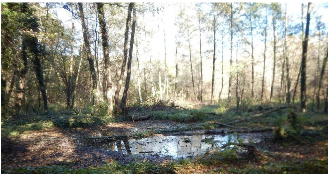
Fotografija 7: Območje obstoječih mlak, ki se napajajo z izviroma 4 in 5.