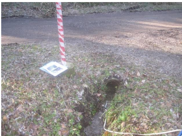
Fotografija 1: Izvir 3 (cevní prepust pod cesto)