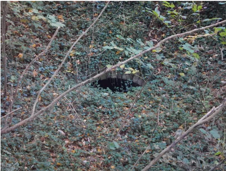
Fotografija 5: Obokana kaverna na območju Izvira 4, ki je zaprta z betonskim zidom.