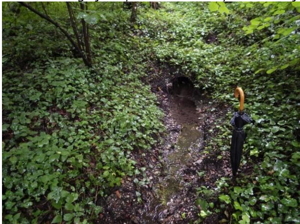
Fotografija 6: Izvir 5 (cevni prepust pod cesto)

V preiskovalnem jašku nad Izvirom 5 je bil ob izvedbi preiskovalnih jaškov odkrit betonski rob, verjetno rob betonskega jaška, in betonska cev, ki se nadaljuje proti brežini terase.