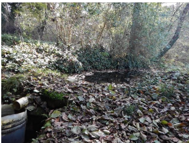
Fotografija 2: Manjša zaježitev izvira 3 za potrebe zalivanja vrtičkov cca 23 m dolvodno od izvira