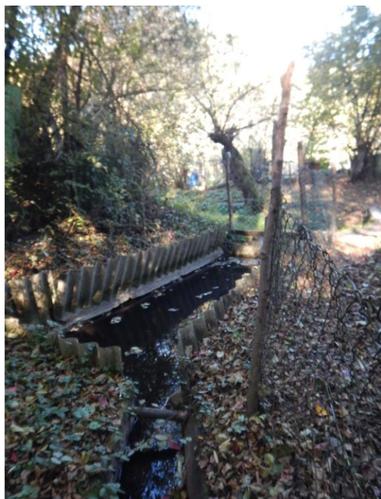
Fotografija 3: Večja zaježitev izvira 3 za potrebe zalivanja vrtičkov tik pred izlivom v Stražunski potok.