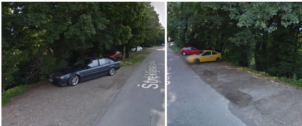
Fotografija 8 in 9: Parkiranje vzdolž Štrekljeve ulice

Zaledje izvirov nad ježo terase, predstavlja pozidano območje naselja Tezno, kjer so prisotne centralne dejavnosti, proizvodnje dejavnosti, območja stanovanj, območja cestnega prometa itd. Odpadne vode s teh območji se odvajajo z urejenim mešanim kanalizacijskim sistemom, tako da ob nemotenem oz. normalnem delovanju kanalizacijskega sistema ne prihaja do obremenjevanja podzemnih vod oz. obravnavanih izvirov. Edini problem in potencialni vir obremenjevanja predmetnih izvirov predstavlja parkiranje osebnih avtomobilov na robu terase, tik nad izviri ob Štrekljevi ulici. Gre za gramozirano »parkirišče« brez urejenega zbiranja padavinskih vod iz parkirnih površin preko lovilcev olj. Zaradi parkiranja popolnoma na rob terase prihaja do propada dreves in posledično do erozije ježe terase in zasipavanja območja predmetnih izvirov.