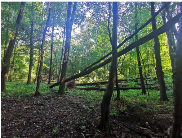
Slika 1: Podrta drevesa, kot posledica neurja.

Opozorilo velja tudi vsem obiskovalcem gozdov, naj se ne gibajo v poškodovanih gozdovih do zaključka sanacije, saj obstaja velika nevarnost padanja visečih in poškodovanih dreves. Varnost je na prvem mestu, zato vsem svetujemo veliko previdnost.